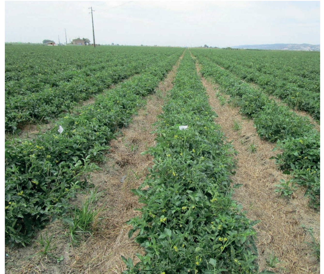
Cultura de tomate, ano 2022, Sistema 2 TomCC (mobilização mínima do solo e cultura de cobertura durante o período em que não há tomate plantado).